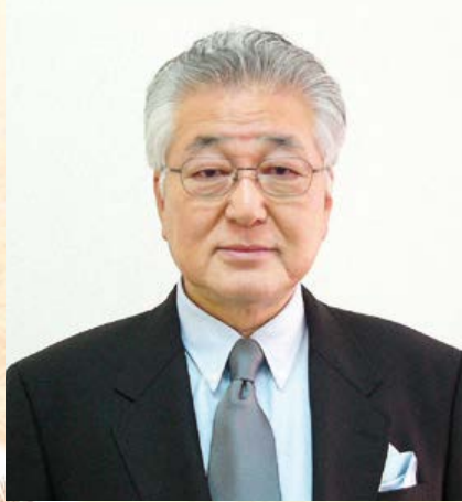
副理事長(食品部会長)