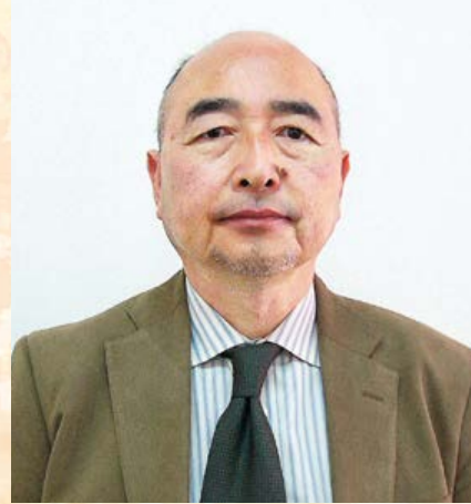
副理事長(繊維部会長)