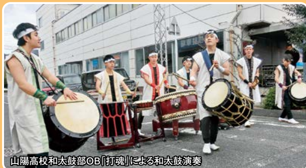
山陽高校和太鼓部OB「打魂」による和太鼓演奏