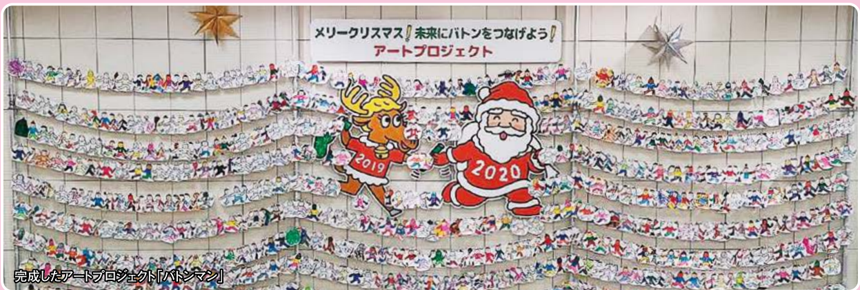
完成したアートプロジェクト「バトンメン」