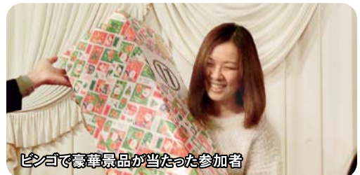
ビンゴで豪華景品が当たった参加者