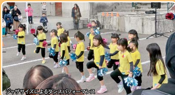
ジャザサイズによるダンスパフォーマンス