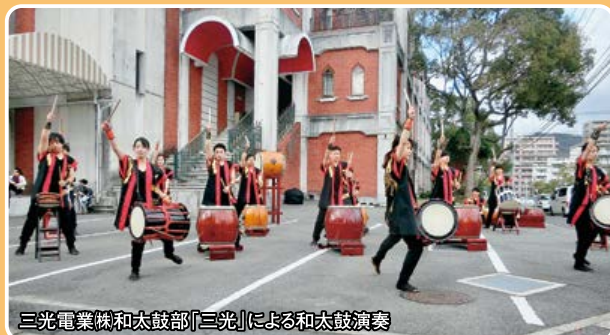
三光電業機和太鼓部「三光」による和太鼓演奏