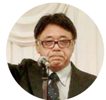
河野副委員長による乾杯